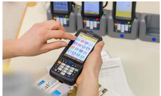
Ein Swiss Post Scanner im Einsatz.

Sunrise bietet der Post Dienstleistungen wie Glasfaserleitungen, Schutz vor DDOS-Attacken (gezielte Server-Überlastung) sowie hochredundante Leitungen für die Absicherung bei einem Ausfall wichtiger Anschlüsse an. Dedizierte IT Security Services laufen ebenfalls über Sunrise. Zudem hat Sunrise für die Schweizerische Post eine innovative Extranet-Plattform eingerichtet, über die alle relevanten Daten laufen: etwa die Interaktion mit den Kunden, Bestellungen, Personalmutationen, Transaktionen, e-Billing, Bestellstatus und zahlreiche weitere Funktionen. So behält die Dienstleisterin immer die Übersicht, und eine umständliche Kommunikation via E-Mail oder Briefe erübrigt sich. Das trägt auch zu mehr Nachhaltigkeit bei – ein Ziel, das bei der Post ganz oben auf der Agenda steht. Selbstverständlich unterliegt diese Plattform den strengsten Sicherheitsbestimmungen ; auch für deren Umsetzung ist Sunrise besorgt.