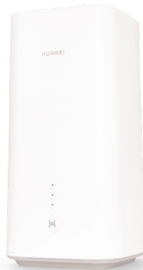
Sunrise Internet Box 5G