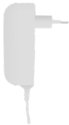
Cavo di alimentazione